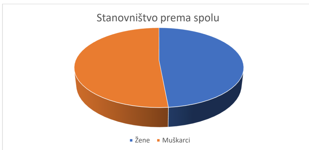
Tablica 3: Stanovništvo Općine Punitovci prema starosti i spolu