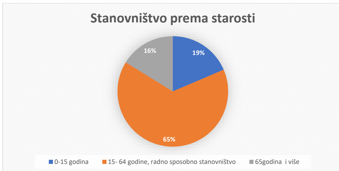
Grafikon 2: Stanovništvo prema starosti