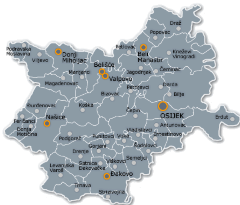
Slika 1: Položaj Općine Punitovci u Osječko-baranjskoj županiji

Općinom prolazi autocesta u koridoru Vc, a pokretač urbanog razvitka čini prostor uz županijske ceste Ž 4106 i Ž 4107.